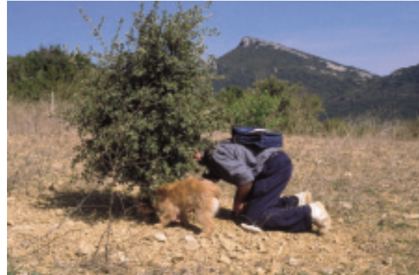
Recogida trufa: Recogida de trufa negra con perro en trufera procedente de repoblación forestal con encinas micorrizadas con este hongo.

de lucro (feria, trabajo comunitario auzolan ), casas rurales, bodegas, cooperativas, hostelería (iniciativas turísticas, jornadas, ferias, cursos)