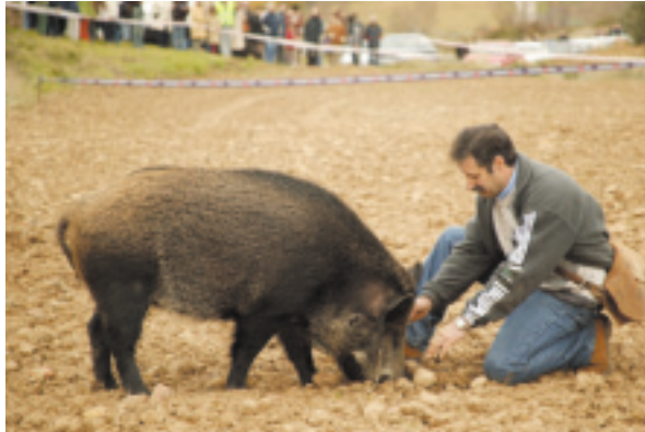
Exhibición de búsqueda de trufa con jabalí. II Feria de la Trufa en Navarra.