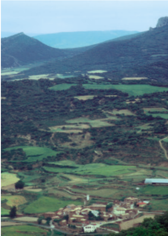
Paisaje valdorbés. Vista del valle.