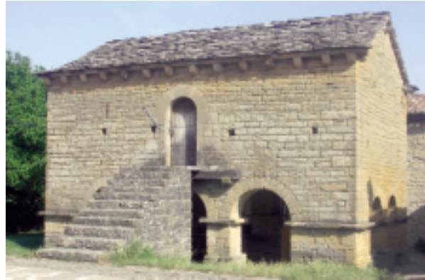
Horreo: Edificio emblemático del siglo XII rehabilitado.