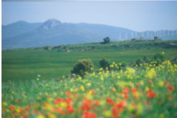
Paisaje valdorbés con vista parcial de su parque eólico.